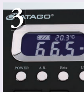
結果を表示します。