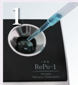
サンプルを目安線まで入れます。